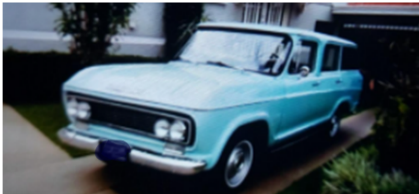
Veraneio ano 1968