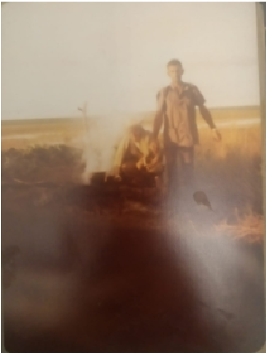
Fotografia tirada em 20/02/1982 - Papai em pé na última pescaria