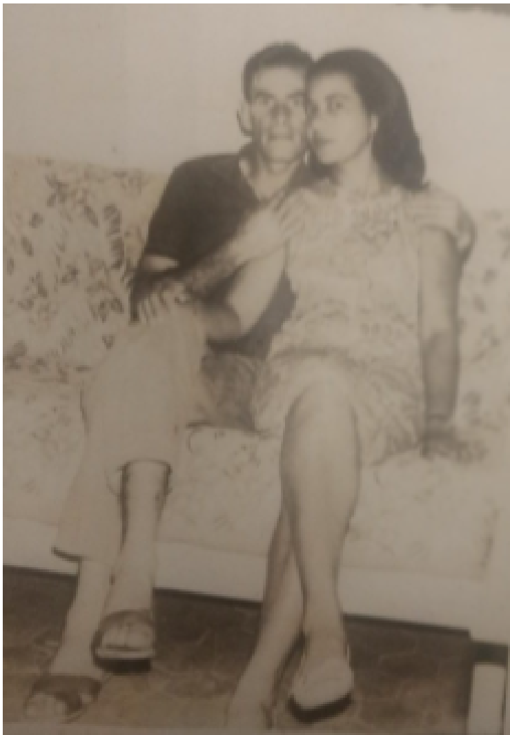
Em 1969 – papai e mamãe